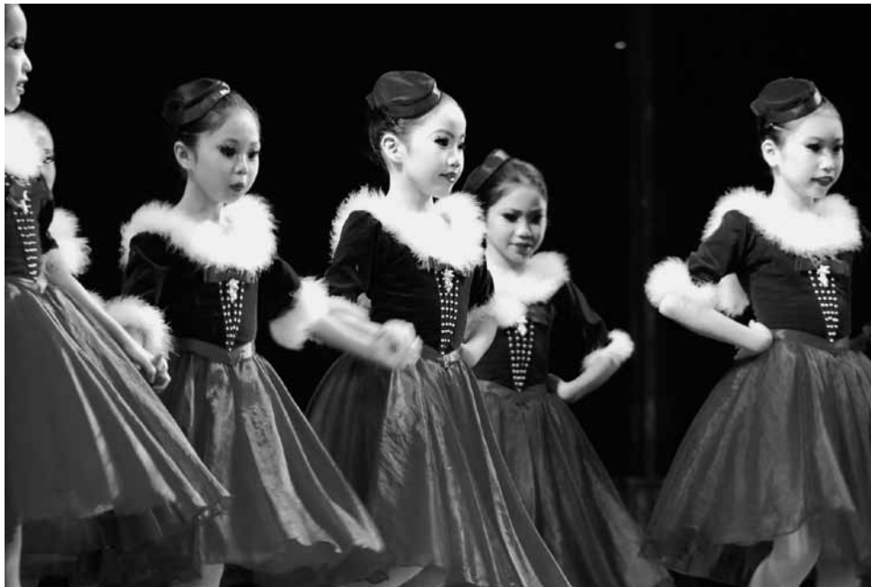
Les Patineurs v podání Angel Ballet Academy, vystoupení u příležitosti desetiletého výročí školy v Honda no Mori Hall Kanazawa, 2010.

Balet se stal populární zábavou, koníčkem a mimoškolní aktivitou mladých dívek z lepších rodin už během minulého století. Malé děti jsou přijímány často od čtyř až pěti let věku a mnoho dívek vydrží ve školách až do své dospělosti. Rodiče podporují děti v tomto zájmu spíše z důvodu přesvědčení o obecné prospěšnosti taneční výchovy než ve víře v jejich budoucí taneční kariéru. Jedno studio může mít více tříd, ročníků či skupin, podle velikosti, možností a počtu lektorů. Mnoho škol má také své pobočky v různých městech téhož regionu a svou vlastní taneční skupinu (složenou často z nejvyšších ročníků či absolventů školy). Děti si mohou vybrat, jak často budou na hodiny docházet, podle věku a pokročilosti je vypracován podrobný rozvrh. Vzhledem ke školní docházce jde o odpolední, podvečerní a večerní časy. Jediným limitem v docházce dítěte jsou finanční možnosti rodiny.