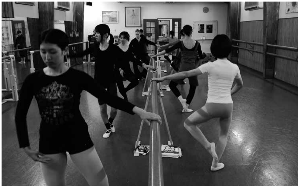
Večerní lekce klasické taneční techniky pro dospělé v Megumi Ballet Studio, Kanazawa 2009.

dívce musí s touto činností skončit se vstupem na vysokou školu, kdy by již tréninky z časových ani finančních důvodů nezahládly. 11 Ty další se realizují v taneční skupině přidružené ke studiu či škole, s trochou štěstí mohou na stejné instituci později vyučovat mladší žáky. Jen velmi málo z nich opravdu hledá uplatnění na taneční scéně, které je ale podmíněno pobytem ve velkých městech (především Tokio, Ósaka). Tam existují baletní soubory či skupiny, které fungují na podobném principu jako baletní studia – členové musí za své tréninky platit. Ziskem pro tanečnický jsou ale nové kontakty, které mohou vyústit v zajímavou pracovní nabídku. Důležitým jevem je neexistence tanečních souborů, které by poskytovaly stálé zaměstnanecké pozice (mimo tradiční divadelní disciplíny), umělci se spoléhají na získání smluv v jednorázových konkrétních projektech (systém našich muzikálů, filmů apod.). Spoléhat se tedy na příjmy z interpretačních projektů je velmi riskantní a mohou si to dovolit jen opravdové hvězdy. Taneční trh využívající taneční techniky přejaté ze západní kultury je ve srovnání s ČR značně užší. Státní orgány podporují spíše tradiční japonské divadlo a jiné taneční produkce jsou tudíž závislé pouze na divácké poptávce. O uplatnění tanečnicků rozhodují producenti a choreografové jednorázových projektů.